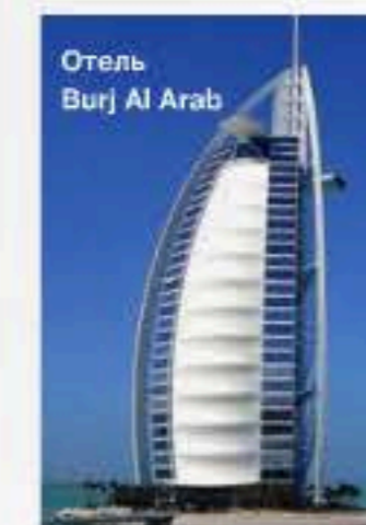
Отель Burj Al Arab

Начальная стадия потребления, первый шаг человека, обладающего деньгами, в мир роскоши, так сказать, — зеркало его бумажника. Отличается примитивизмом, поскольку все приобретаемые материальные ценности выражаются в «Гуччах» — то есть только в самых дорогих и известных брендах: если одежда — то Gucci или Chanel; если автомобиль — то Maybach или Bugatti; если украшения — то Cartie, если отель — то Burj Al Arab и т.д.