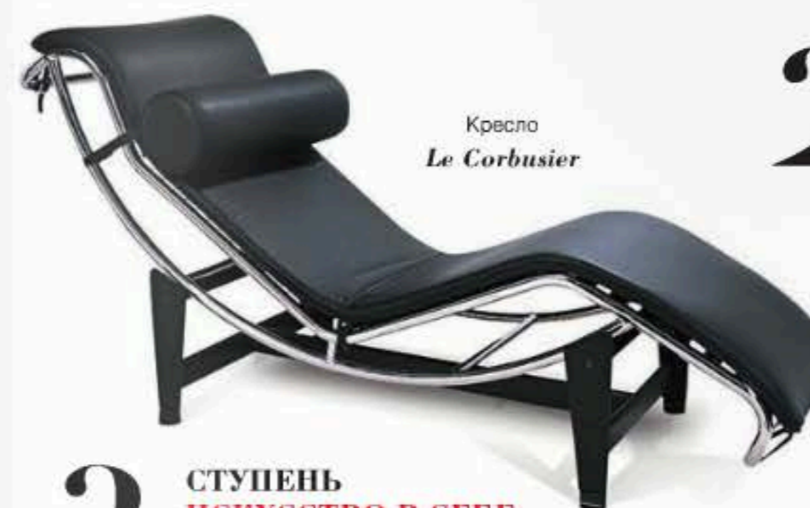
Кресло Le Corbusier