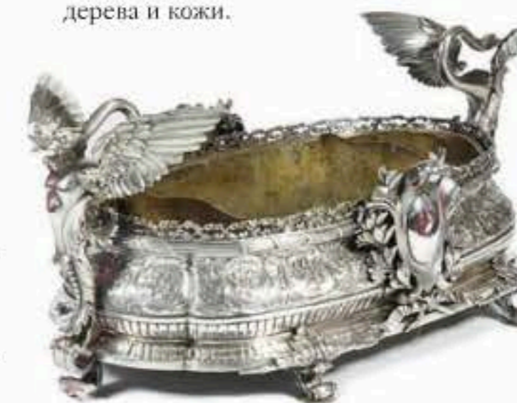
Серебряная жардиньерка, XVIII век

Количество накопленного опыта потребления перерастает в качество. Наступает, если можно так выразиться, стадия «скромного обаяния буржуазии». Характеризуется функциональным минимализмом в дизайне и отсутствием золотого цвета как символа роскоши. Человек начинает окружать себя качественными дорогими вещами, истинную ценность и стоимость которых способны оценить немногие — либо профессионалы, либо люди одного с ними круга.