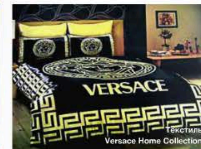
Текстиль Versace Home Collection