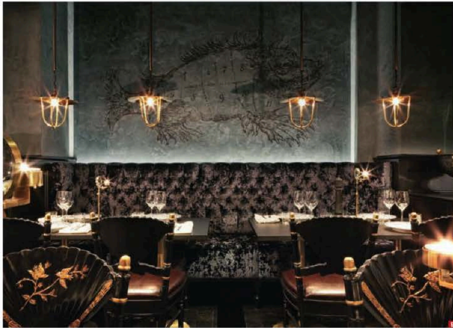
6.- El Gotthards, como el resto del hotel, es una apasionante mezcla de lo lujoso y lo tosco, como el sofá de terciopelo coronado por una calavera tallada, los pulpos acechando desde el papel pintado y las mesas con cómodos sofás corridos iluminadas por faroles de barco. Los motivos de las habitaciones del hotel, como fragatas, relojes de arena, Neptuno con su tridente, gaviotas y trabajos con cabos, también pueden verse en los servicios de mesa, azules y blancos, especialmente diseñados para el restaurante.

ESTABLECIMIENTO. Stora Hotellet (Umeå, Suecia). | AUTORES DEL PROYECTO. Stylt Trampoli. | INTENCIONALIDAD Y FILOSOFÍA DE LA OBRA. Devolver el esplendor originario al que fue, durante más de un siglo, el hotel más lujoso de Umeå. | PRINCIPALES PAUTAS DECORATIVAS. El equipo de Stylt Trampoli se inspiró en el contraste entre el mundo de los marineros y el de la alta sociedad, que en su día se codearon y compartieron las estancias del hotel. De esta manera lo refinado dialoga con lo más tosco: lona, terciopelo, espuma marina y champán.