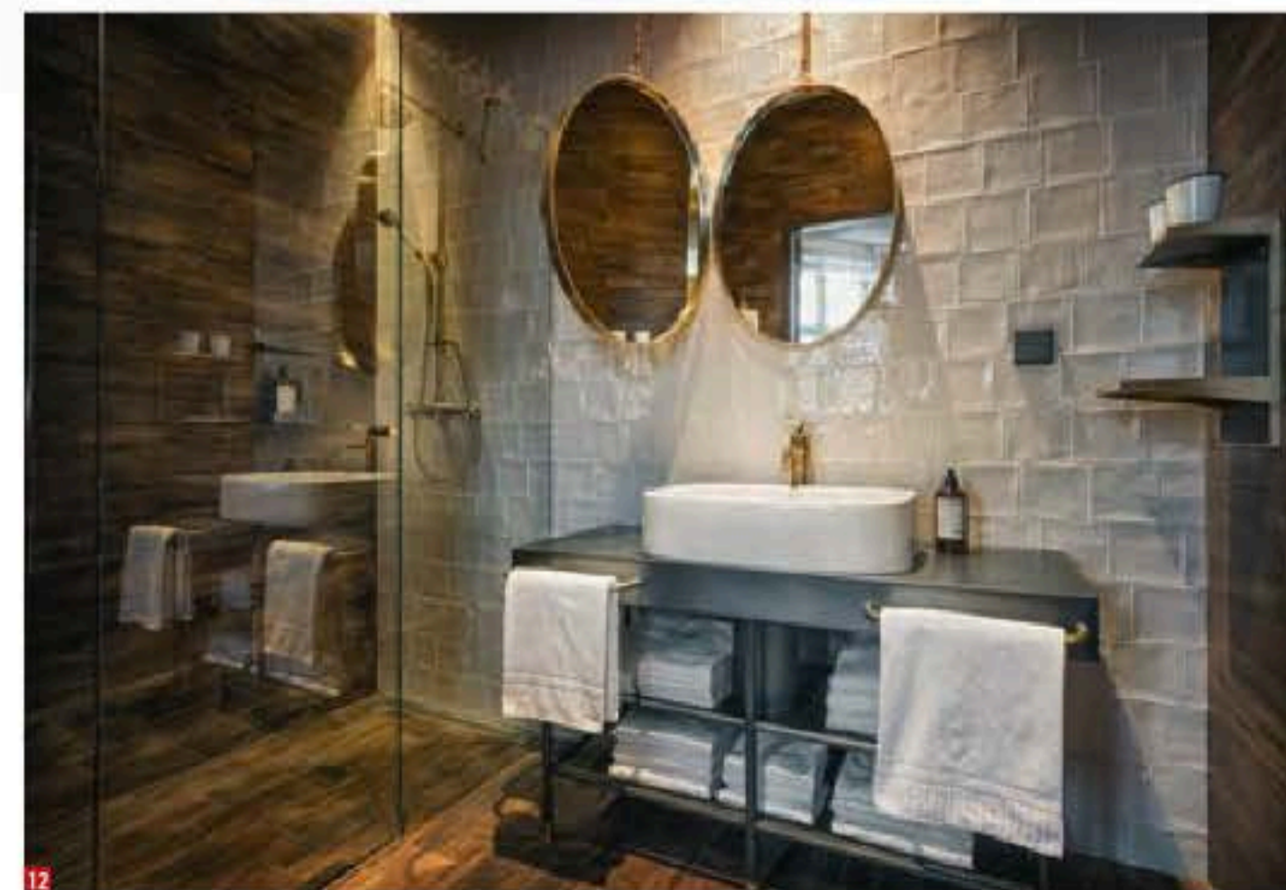
11 y 12.- Como el hotel fue construido por la Seaman's Mission de Umeå, las categorías de las habitaciones toman el nombre de conceptos clave de la visión del mundo que tenían los marineros: 'Aventura' (foto 10), 'Pasión' (fotos 11 y 12), 'Ahoranza, Misticismo' (fotos 13 y 14), 'Superstición o Libertad' (fotos 15 y 16), e incluyen desde la lujosa suite principal con su propia sauna hasta acogedores "camarotes" donde los huéspedes duermen en literas de generosas dimensiones, bajo los aleros del hotel.